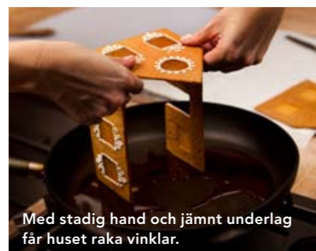
Med stadig hand och jämnt underlag får huset raka vinklar.