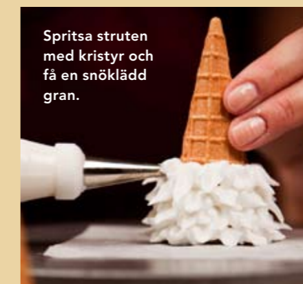
Spritsa struten med kristyr och få en snöklädd gran.

3. När granen har stelnat målar man lite grönt här och var på granen, med grön livsmedelsfärg.