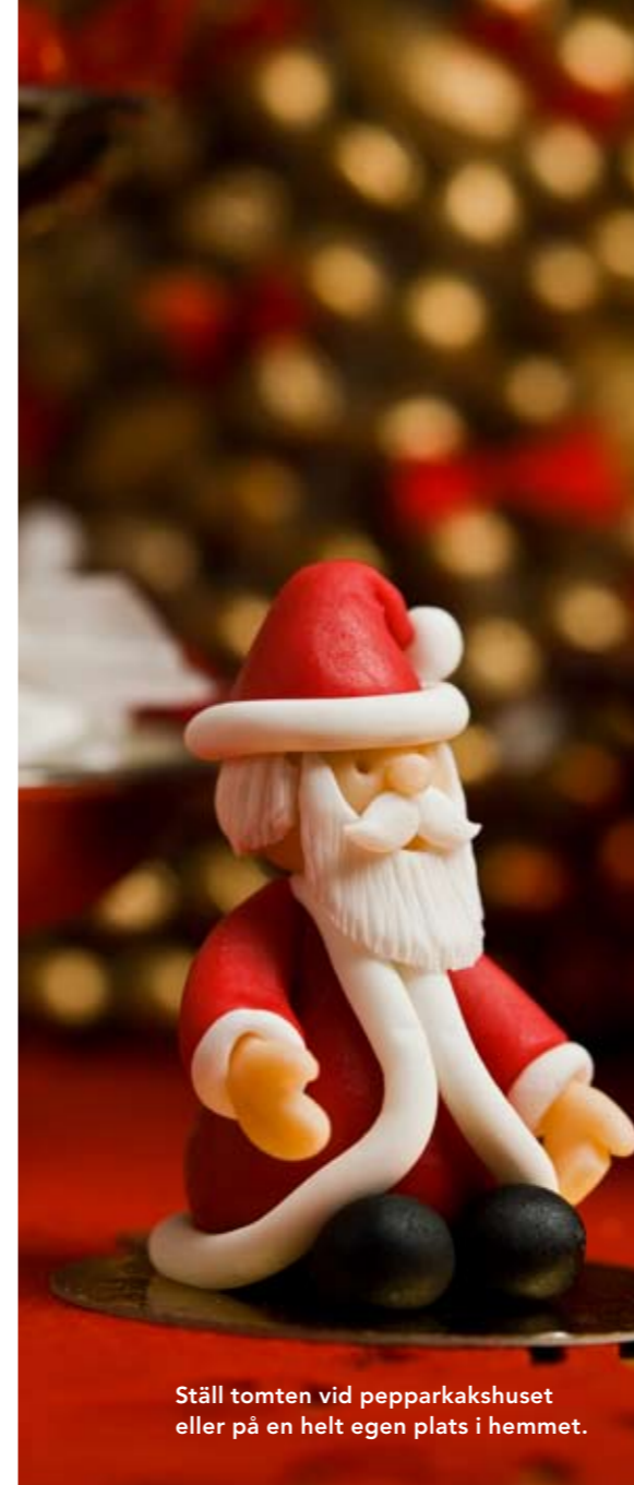
Ställ tomten vid pepparkakshuset eller på en helt egen plats i hemmet.