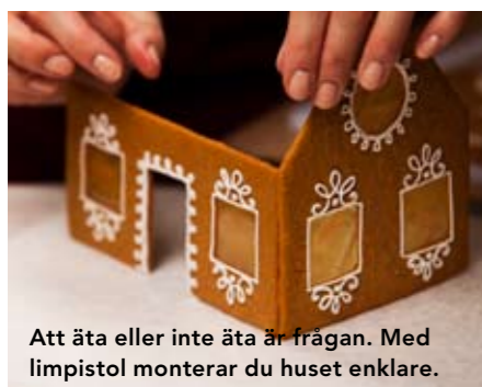
Att äta eller inte äta är frågan. Med limpistol monterar du huset enklare.

2. Håll gärna till på ett bakplåtspapper eller liknande när du monterar. Ordningen hur du fäster delarna är samma som för smält socker, men det är lättare då man slipper att lyfta huset.