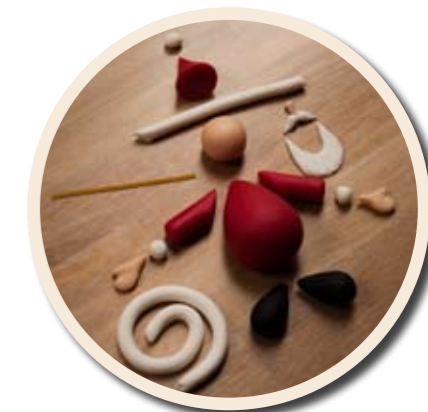
Alla delar färgade, formade och klara!