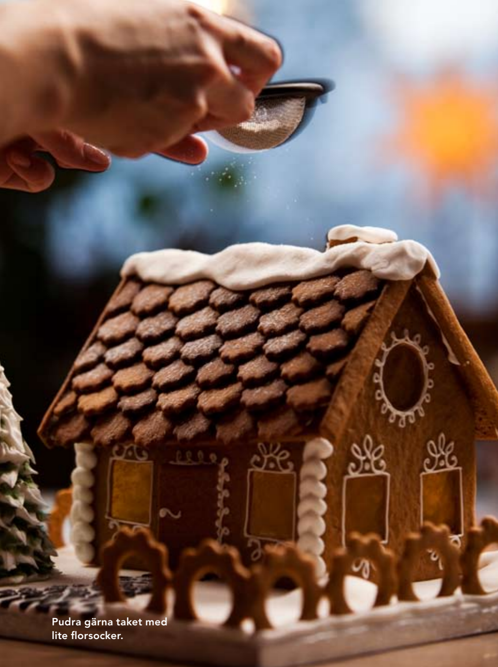
Pudra gärna taket med lite florsocker.