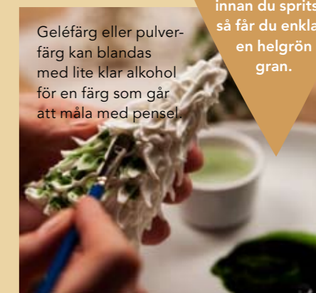
Geléfärg eller pulverfärg kan blandas med lite klar alkohol för en färg som går att måla med pensel.