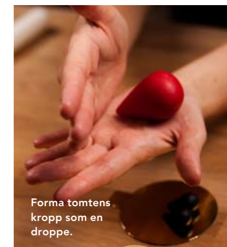
Forma tomtens kropp som en droppe.

cera varje blad lite förskjutet så att det inte blir ett regelbundet mönster. Det får gärna vara lite olika längd på bladen och olika riktning på dem, för ett naturligare utseende. När hela struten är täckt med kristyr, ställ för att torka.