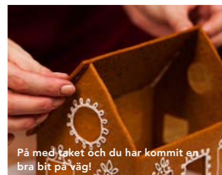
På med taket och du har kommit en bra bit på väg!