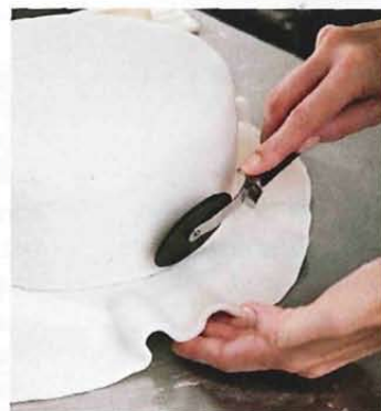
Med en pizzaskärare är det lätt att skära av kanten.