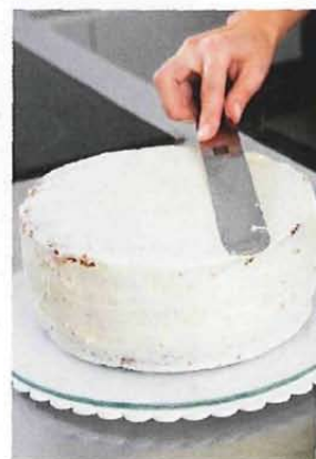
Smörkräm är viktigt för att inte moussefyllningen ska lösa upp sockerpastan.