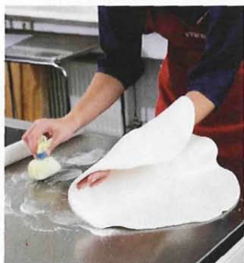
Kavla en rundel i taget. Lyft med hjälp av underarmarna och var noga med att pudra arbetsbänken mellan varje kavling.