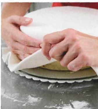
För att inte pastan ska vecka sig, lyft och släta ut med handen.